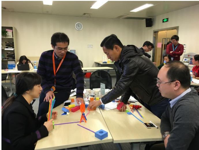
拼图游戏建模活动在课程中的应用场景