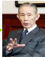
王永庆： 中国的“经营之神”，台塑集团创办人。 经营手法：利润中心（Min-SBU量化分权）

他既没受过高等教育，也没有学过什么管理学的理论和方法，却在30岁（1924年）的时候创造了至今仍在世界范围内被企业普遍采用的经营手法。他一度带领松下成为世界排名前10位的大公司，被誉为世界上最了不起的企业家。