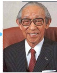
松下幸之助： 日本“经营之神”，松下集团创办人。 经营手法：事业部经营（SBU量化分权）

他既没受过高等教育，也没有学过什么管理学的理论和方法，却在30岁（1924年）的时候创造了至今仍在世界范围内被企业普遍采用的经营手法。他一度带领松下成为世界排名前10位的大公司，被誉为世界上最了不起的企业家。