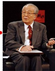
稻盛和夫： — 唯一健在的“经营之圣”； — 白手起家，成就3家世界500强； 经营手法：阿米巴经营（Cell-SBU量化分权）

王永庆与松下的经营方式异曲同工。台塑集团目前下辖南亚、台塑石化、塑胶工业等十多家核心二级企业集团，分别进行独立核算。2011年台塑集团营业额合计约800亿美元，营业利润约90亿美元。台塑集团经营稳健，持续几十年保持高利润。