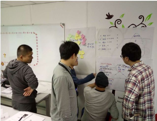
陈老师运用促动技术，激发学员成为课堂的主人