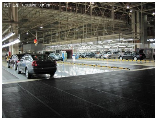
(图：总装车间一角，大批量的成车在这里等待检验，准备出厂)

进入这里，袭来的已经不再是之前的那种高科技科幻感，而是一种极为强烈的物质冲击……霎那间的想法就是：在这儿永远都不用愁没有车开！放眼望去遍地是车， 新领驭 、 途安 、 明锐 、 昊锐 ……按照随行工作人员的说法，这里每两分多种便有一辆车检验合格并下线，崭新的车停放在这里等待检验，可以说，这里是一个巨大的汽车产房，一辆又一辆我们再熟悉不过的车型正由此诞生。