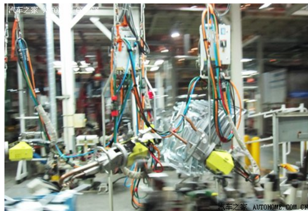
(图：用于焊接的高精度焊接枪)

一圈看下来，对车身制造有了些了解，只可惜上海大众的拿手好戏——激光焊接工艺只能够通过一个液晶显示屏看到操作过程：一道激光在两个车身配件（车顶与侧围）接触的地方划过，用超过 1400°C 的高温将连接处的钢板融化并融合在一起，形成了整体无缝的结构。通过显示屏我们只能看个大概，但看到那硕大的橙黄色机器人不断精确地舞动着机械手臂，心里突然一阵“高科技！”的感觉，与其说是在参观工厂，倒更有些像是在看一部科幻电影的拍摄现场。这种感觉，在路过仓库的时候更强烈。