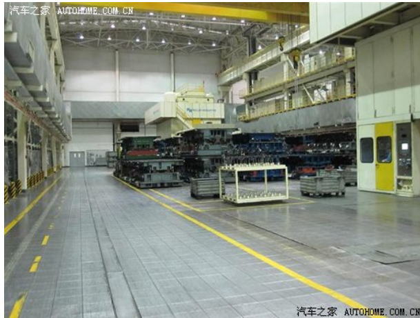
(图：几乎无人的冲压车间，全自动的机械在不断运作)