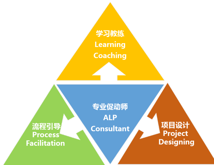
ALP: Action Learning Program