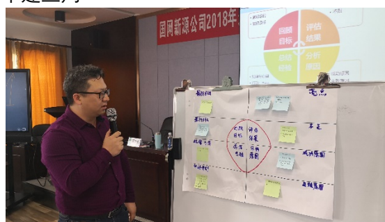
国网新源处级干部复盘课