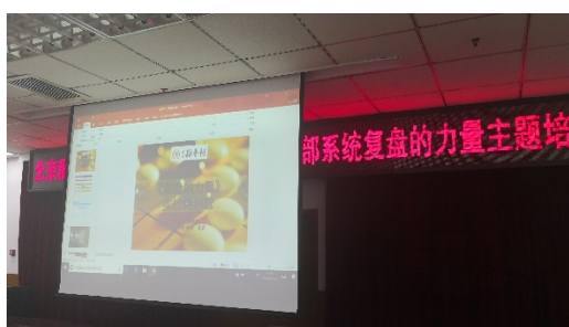
北京稻香村中高层管理者两期复盘课