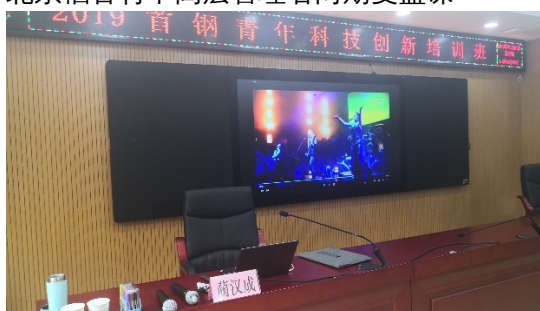
首钢青年科技领军人才2018年、2019年复盘课