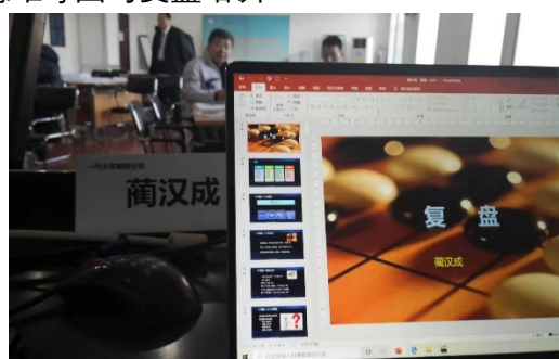
长春一汽解放公司