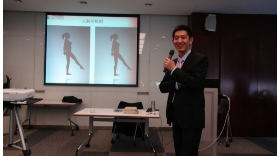
西安高新区管委会