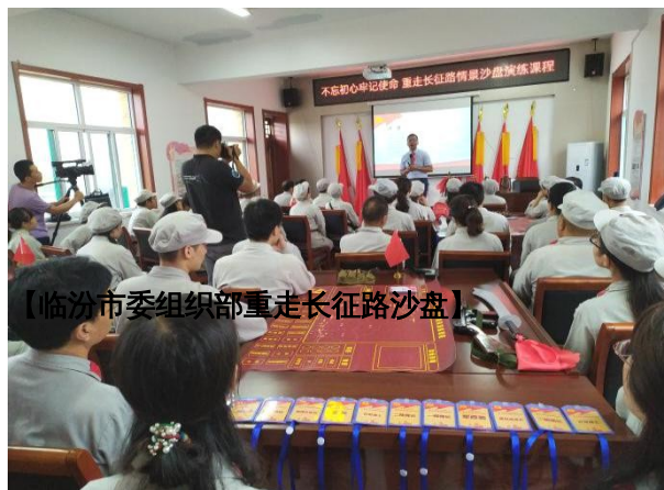
【临汾市委组织部重走长征路沙盘】