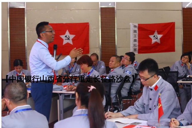
【中国银行山西省分行重走长征路沙盘】