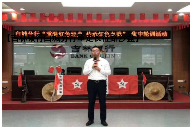
白城分行“重温红色经典 传承红色血脉”集中轮训活动