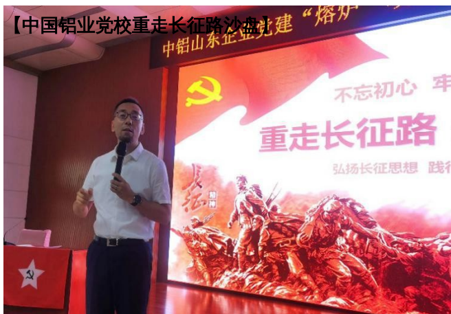
【中国铝业党校重走长征路沙盘】建“熔炉”