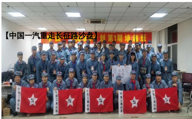
【中国一汽重走长征路沙盘】期第1期培训班