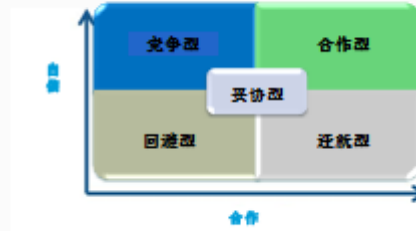
Thomas-Kilmann 冲突风格模型 (TKI)