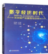
书名： 《数字经济时代-区块链产业案例分析》 出版时间： 2018 合著