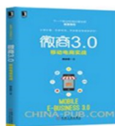
书名： 《微商3.0 移动电商实战》 出版时间： 2016 独著