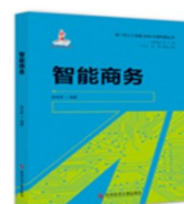
书名： 《智能商务》 出版时间： 2021 独著