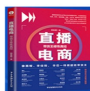
书名： 《直播电商-带货王真经》 出版时间： 2021 独著