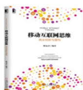
书名： 《移动互联网思维：商业创新与重构》 出版时间： 2015 独著

智库软实力研究院高级研究员大数据中心主任、移动电商研究院执行院长、国内顶级管理咨询公司资深顾问，国际市场研究公司总监、带队做过上百家企业的战略规划，组织流程营销体系、人力资源、创新管理等多个项目，多家企业的营销顾问。中央电视台电商栏目专家、经信委入库专家。在企业管理微创新提升方面有着丰富的经验。在国内多个主流媒体发表过几十篇新媒体营销的研究文章。授课贴近实战，擅长案例教学。