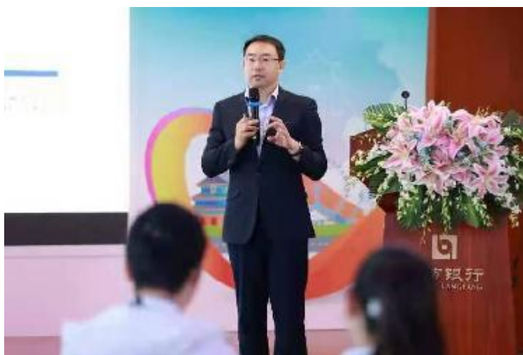
为邮储总行讲授北交所成立对商业银行的影响