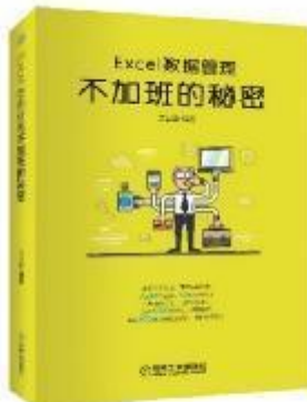
《Excel数据管理：不加班的秘密》 2017-12