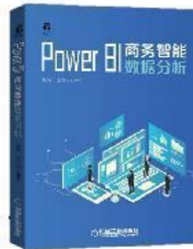
《Power BI 商务智能数据分析》 2020-12