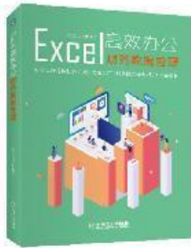
《Excel高效办公：财务数据管理》 2019-7