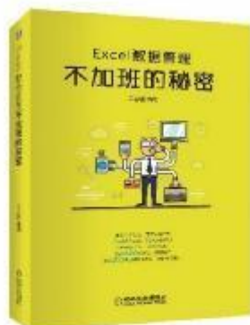
《 Excel 数据管理：不加班的秘密 》 2017-12