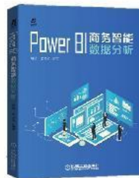
《 Power BI 商务智能数据分析 》 2020-10