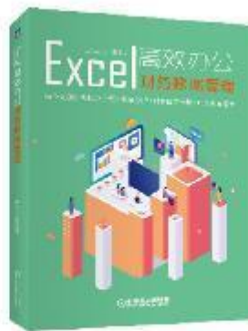
《 Excel 高效办公：财务数据管理 》 2019-7