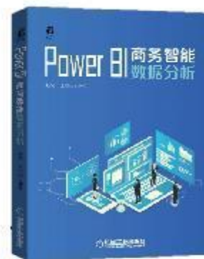
《Power BI 商务智能数据分析》