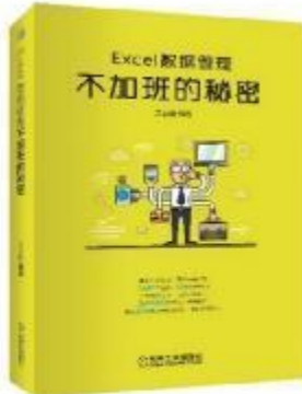
《Excel数据管理：不加班的秘密》 2017-12