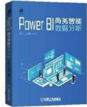
《Power BI 商务智能数据分析》 2020-12