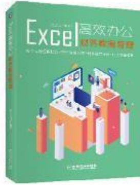
《Excel高效办公：财务数据管理》 2019-7