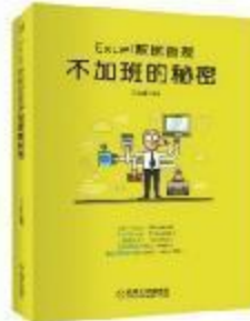
《Excel数据管理：不加班的秘密》 2017-12