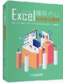
《Excel高效办公：财务数据管理》 2019-7