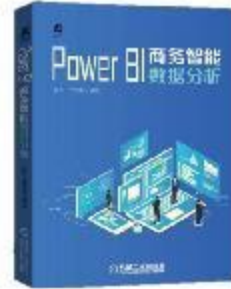
《Power BI 商务智能数据分析》 2020-12