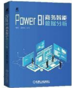
《Power BI 商务智能数据分析》