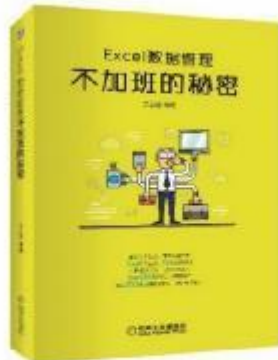
《Excel数据管理：不加班的秘密》