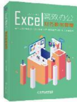
《Excel高效办公：财务数据管理》