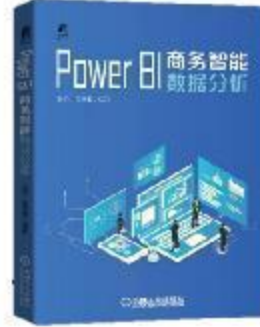
《Power BI 商务智能数据分析》 2020-12