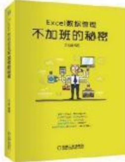
《Excel数据管理：不加班的秘密》 2017-12