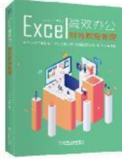
《Excel高效办公：财务数据管理》 2019-7