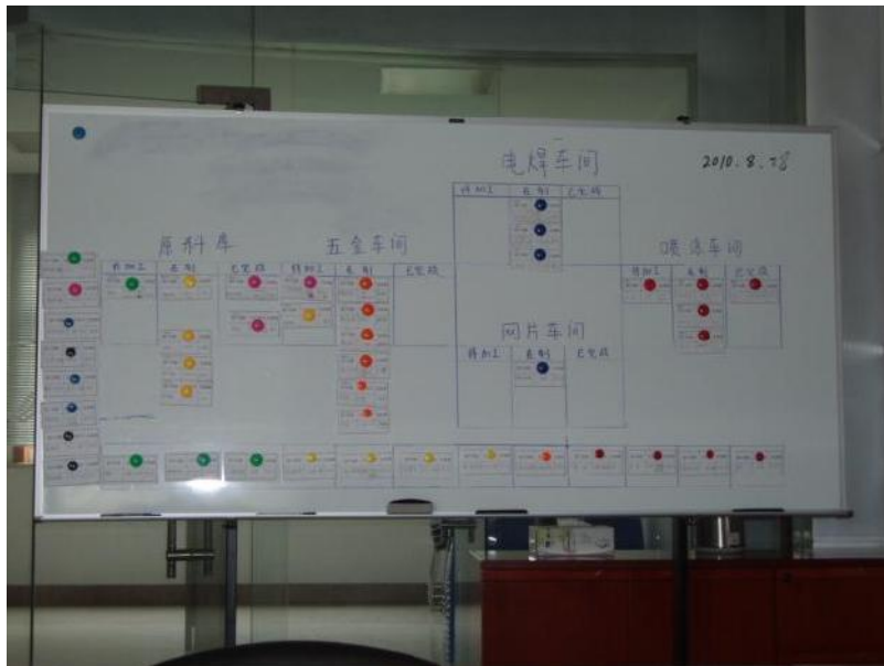
3、物料采购工具《拉动看板》