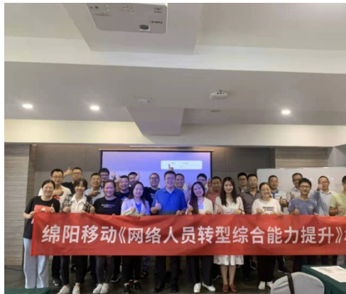
绵阳移动骨干转型综合能力提升