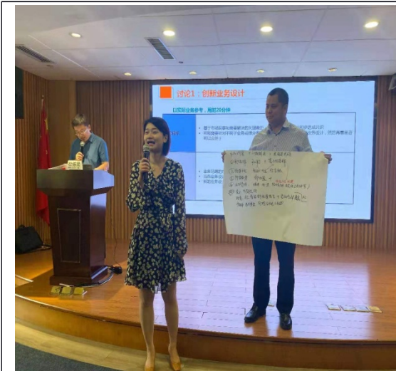
平安银行组织能力提升培训