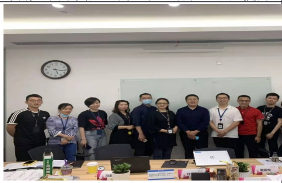
咪咕科技 面试技术与背调技术训练