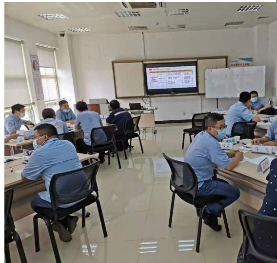
连云港核电 关键任务管理与管理创新