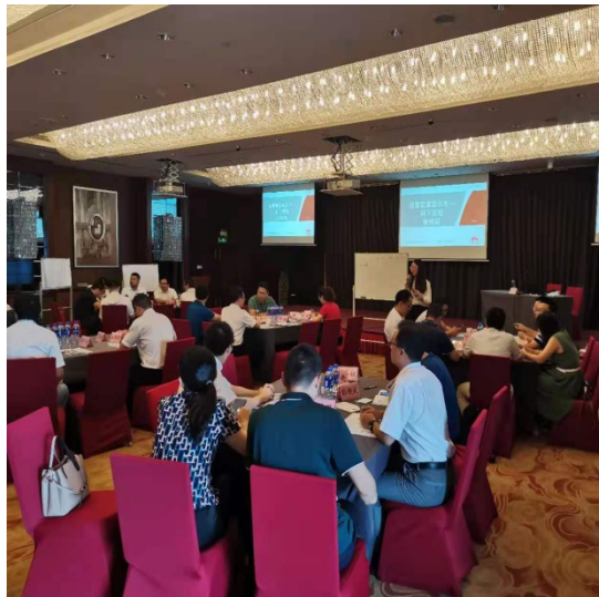
安徽铁塔：情景管理高尔夫---向下管理