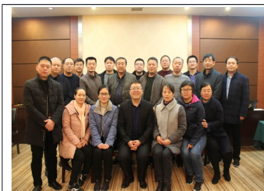
盐城国电绩效管理实操训练班