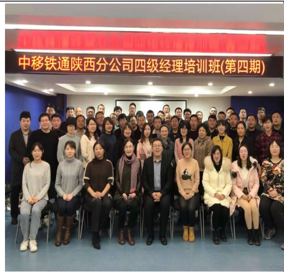
陕西铁通执行力打造+绩效管理能力提升