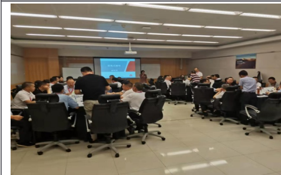
华为安徽技术团队 教练式管理培训