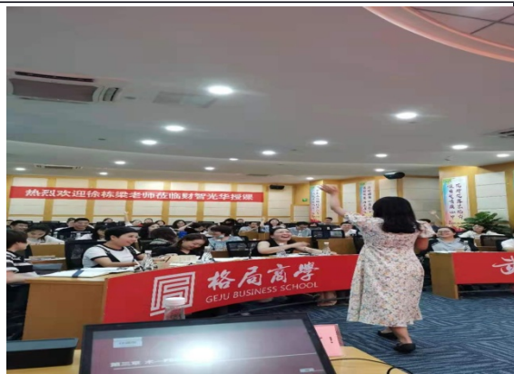
财智光华商学院 中高层管理者管理能力提升