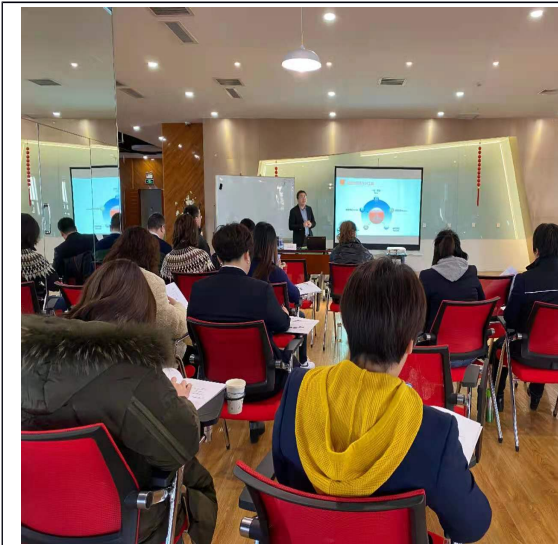
阳泉移动 绩效管理如何有效落地