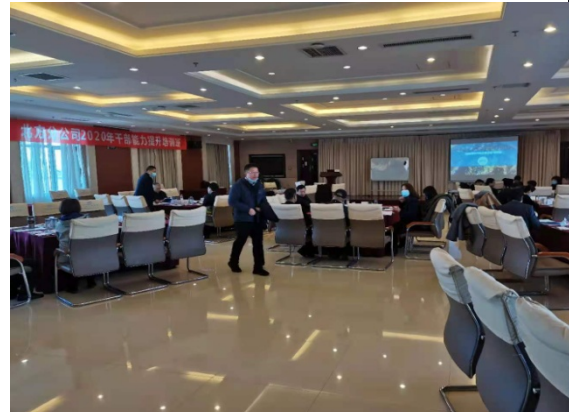
南航北方公司 管理干部阿米巴经营实战