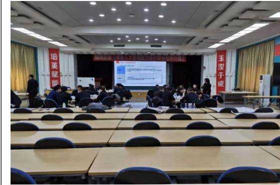
朝阳联通 储备人才管理能力提升