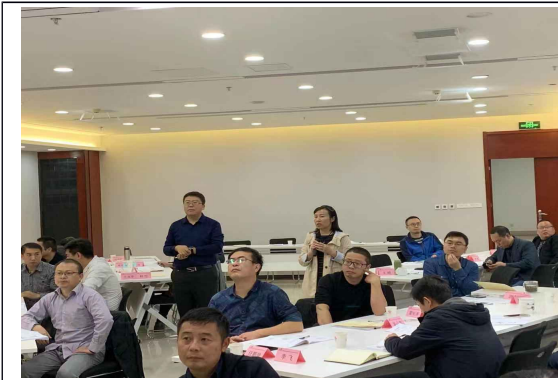
襄阳联通非人+领导力培训