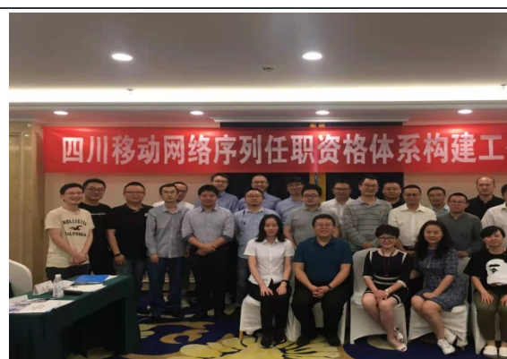
四川移动 任职资格体系搭建工作坊