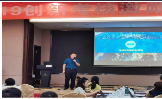
深圳兴业银行考核与薪酬激励机制重塑