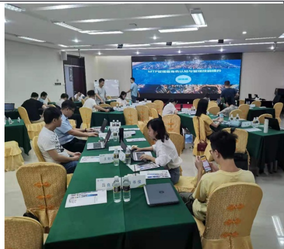
海南移动 MTP 管理者角色认知与技能提升训练