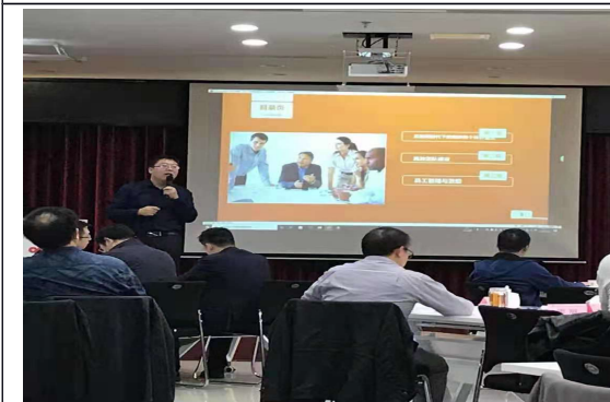
西安移动业务领导力培训