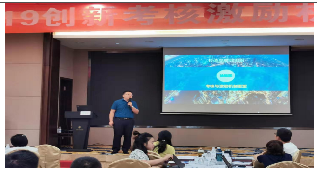
深圳兴业银行考核与薪酬激励机制重塑