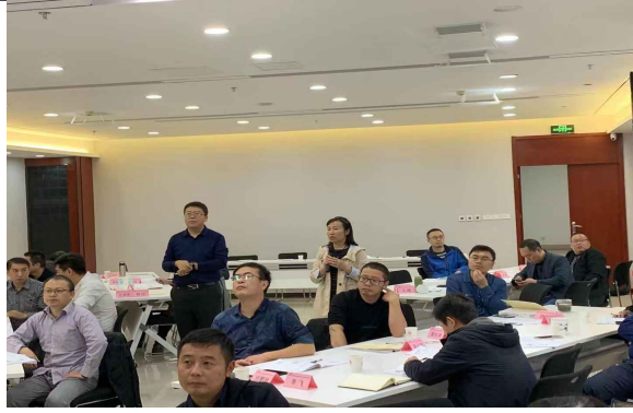
襄阳联通非人+领导力培训