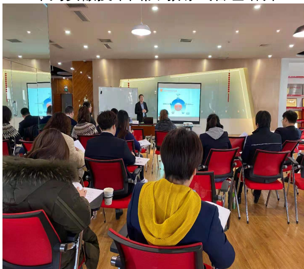
阳泉移动 绩效管理如何有效落地