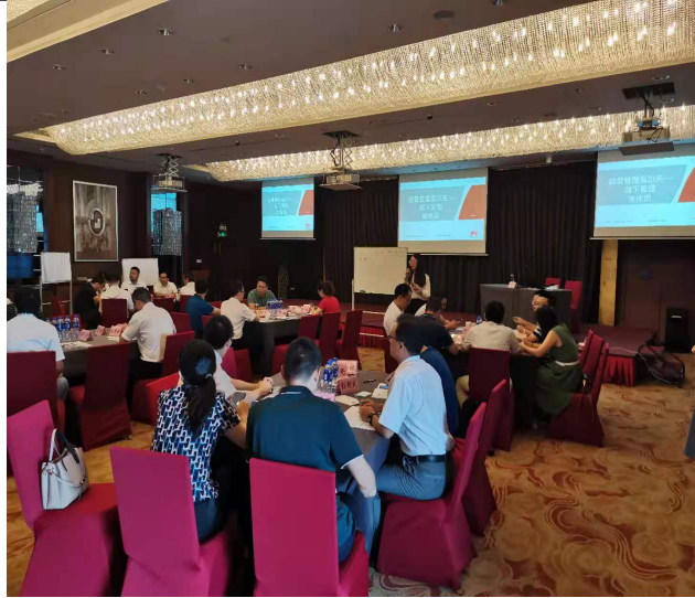
安徽铁塔：情景管理高尔夫---向下管理