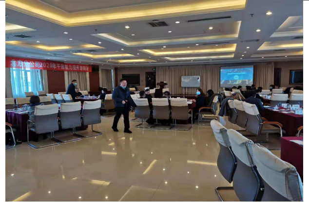
南航北方公司 管理干部阿米巴经营实战