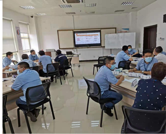
连云港核电 关键任务管理与管理创新