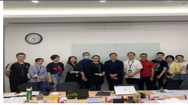
咪咕科技 面试技术与背调技术训练