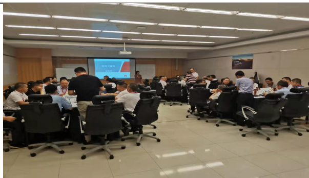
华为安徽技术团队 教练式管理培训