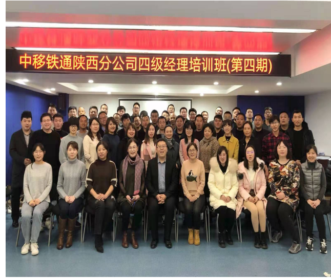
陕西铁通执行力打造+绩效管理能力提升