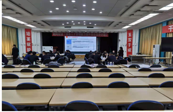
朝阳联通 储备人才管理能力提升