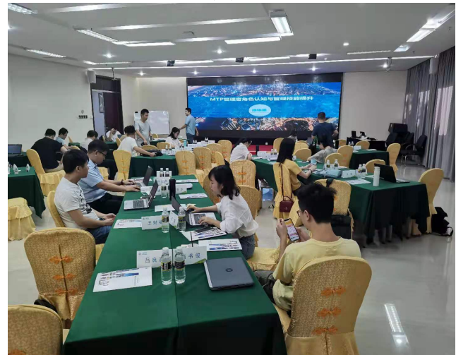
海南移动 MTP 管理者角色认知与技能提升训练