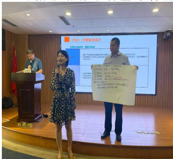
平安银行组织能力提升培训