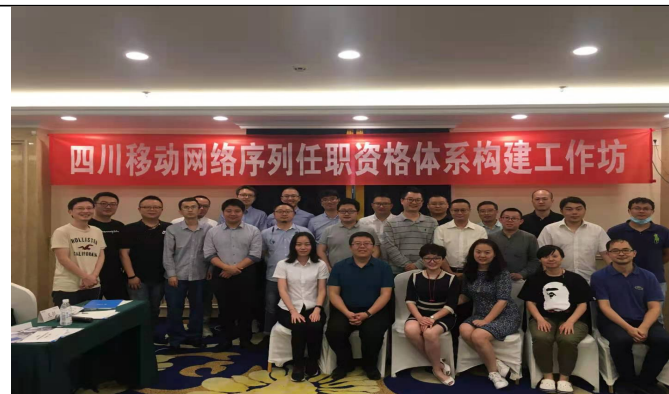
四川移动 任职资格体系搭建工作坊