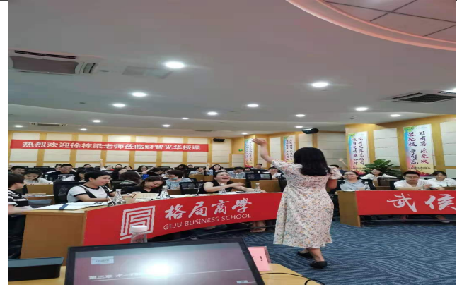
财智光华商学院 中高层管理者管理能力提升