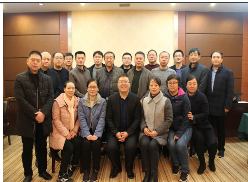
盐城国电绩效管理实操训练班