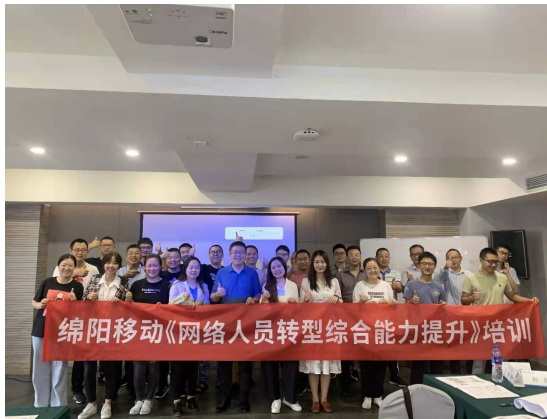
绵阳移动骨干转型综合能力提升