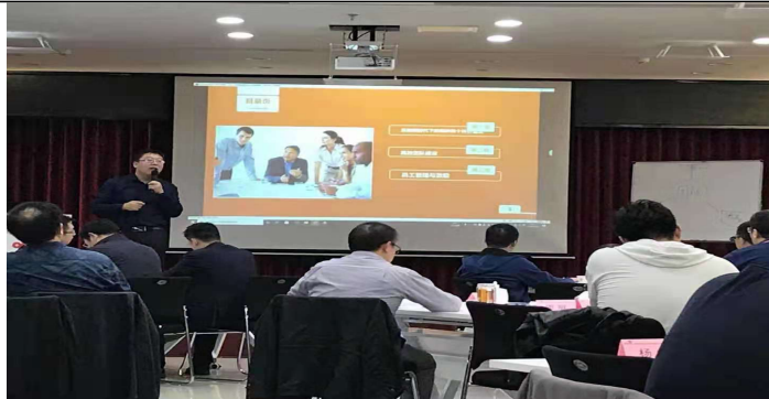
西安移动业务领导力培训