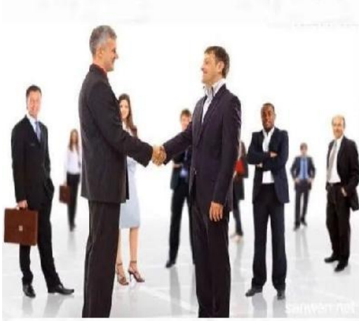
政务接待礼仪培训