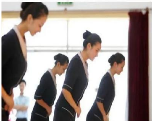
服务意识礼仪培训