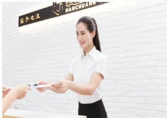
行政前台接待礼仪培训