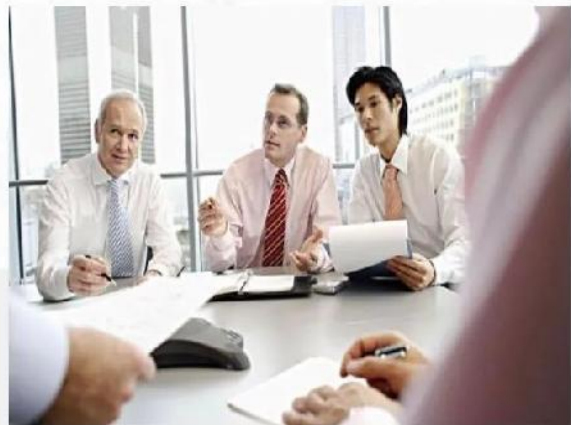
建筑行业商务礼仪培训