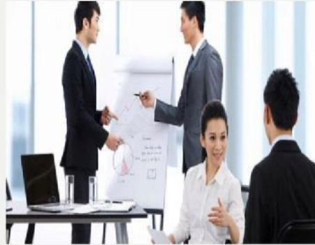
销售人员约见客户礼仪