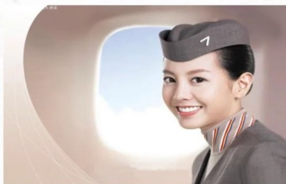
高速窗口礼仪培训