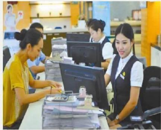
政务公文礼仪培训