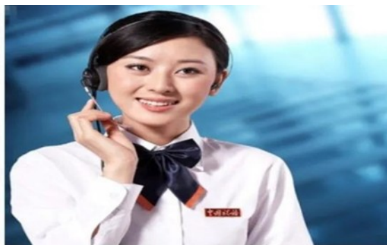
电话客服礼仪培训