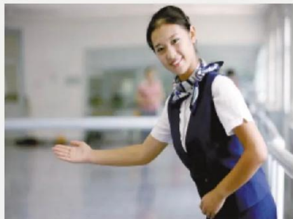
亲民形象礼仪培训