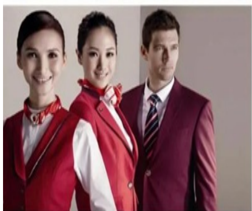
服务技巧礼仪培训