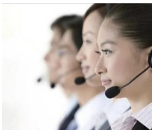
服务沟通礼仪培训