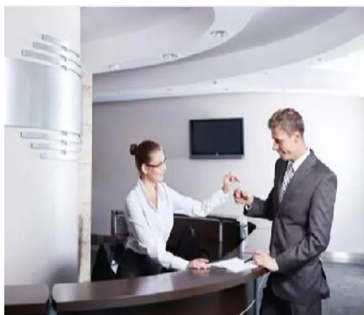
教育机构接待礼仪培训