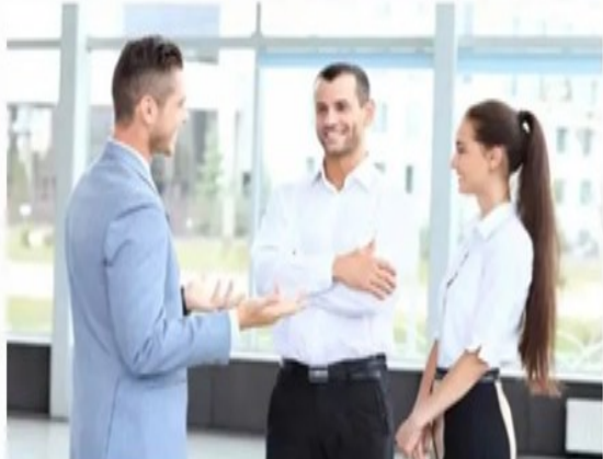
管理沟通礼仪培训