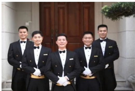
物业服务礼仪培训