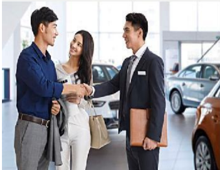
服务营销礼仪培训