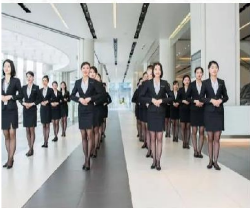
房地产销售礼仪培训