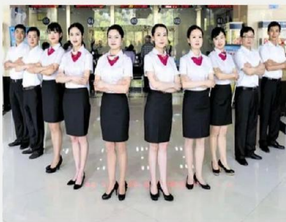
银行证券金融礼仪培训