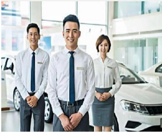
汽车销售礼仪培训