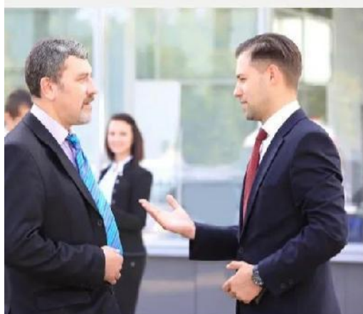
商务拜访礼仪培训