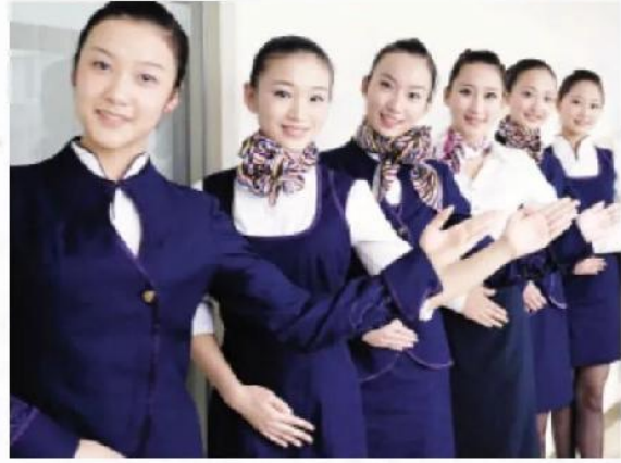
会务接待礼仪培训