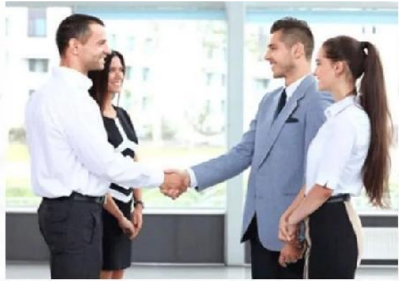
商务接待礼仪培训