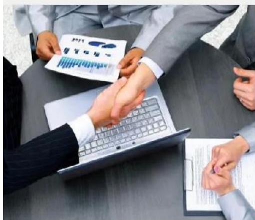
环保行业商务礼仪培训