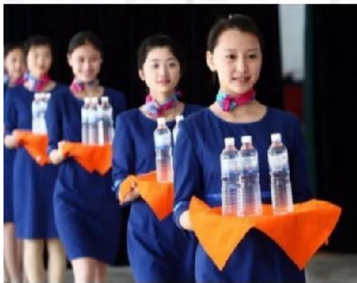
服务形象礼仪培训