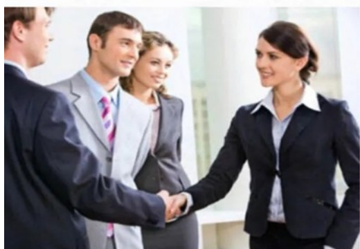
国际商务礼仪培训