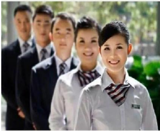
商超百货服务礼仪培训