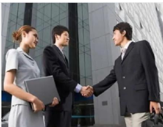
能源行业商务礼仪培训