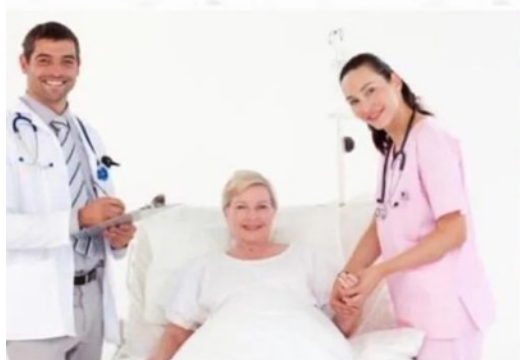
医院服务礼仪培训