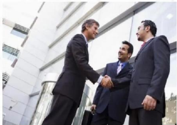
客户触点设计培训