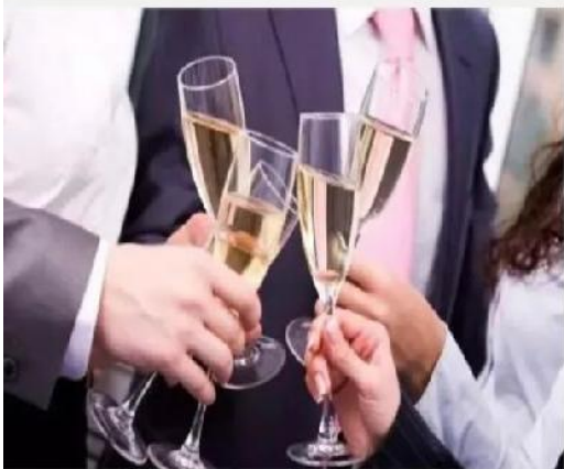
商务宴请礼仪培训