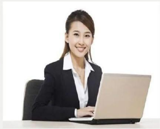
秘书助理礼仪培训