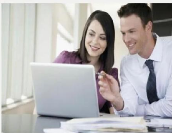
异议处理礼仪培训