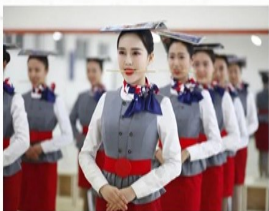
职业素养礼仪培训