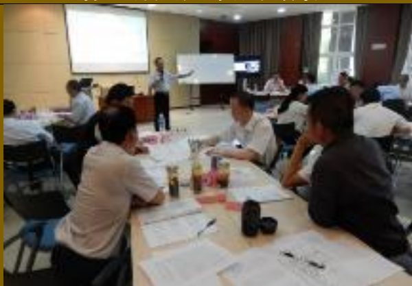
云南驰宏锌锗公司 《领导整合思维训练》