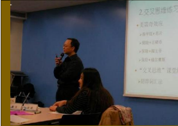
华泰保险总公司 《系统管理创新》