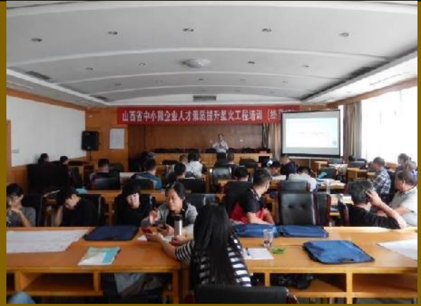
山西省公开课 《创新与创业管理》