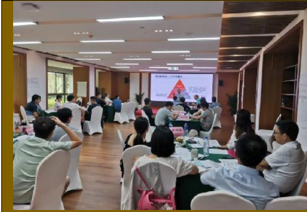
2022年8月中国中铁投资公司 《领导者整合思维训练》