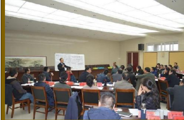
山东大明集团 《系统管理创新》