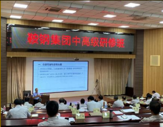
2021年9月鞍钢集团 《创新思维与领导决策》