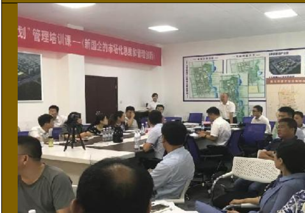
山东恒建集团 《新国企的市场化思维和管理创新》