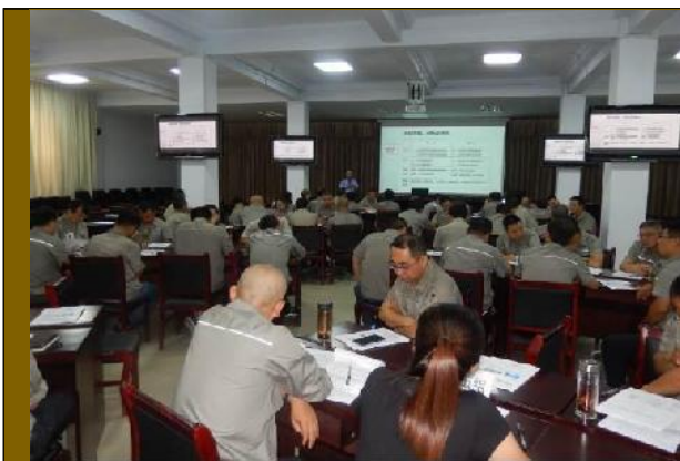
2019年河北宣钢集团 《市场化转型与管理变革》