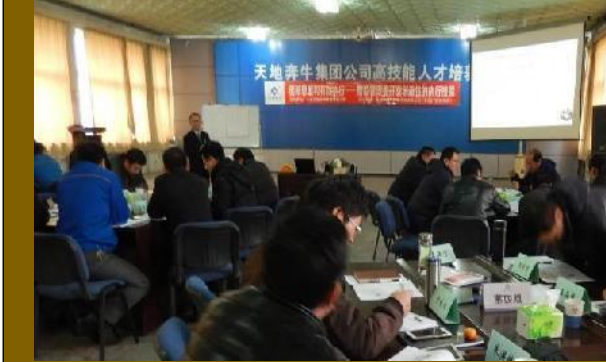
宁夏天地奔牛集团 《创新思维与有效执行》