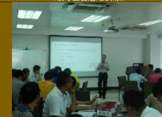
广东火电公司整合思维训练 2 场