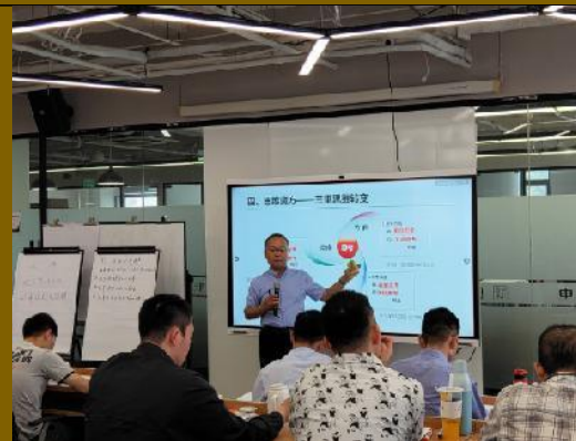
2021年9月北京国能中电公司 《系统思维与科学决策》