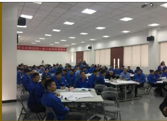
湖北黄石东贝集团 《领导决策：通过创新激发高绩效》