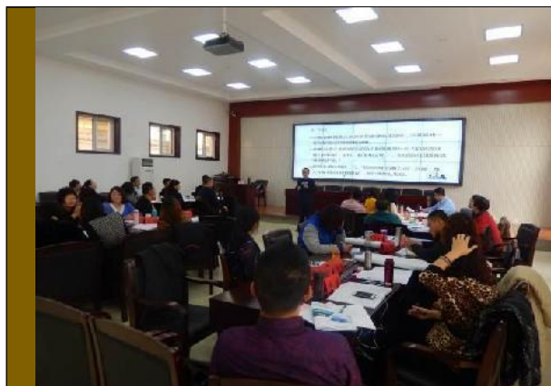
中国农业银行内蒙古分行 《新常态下的创新思维和管理创新》