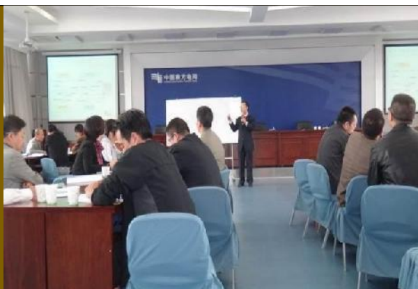
云南曲靖市供电公司 《打造创新型管理技能和领导力》