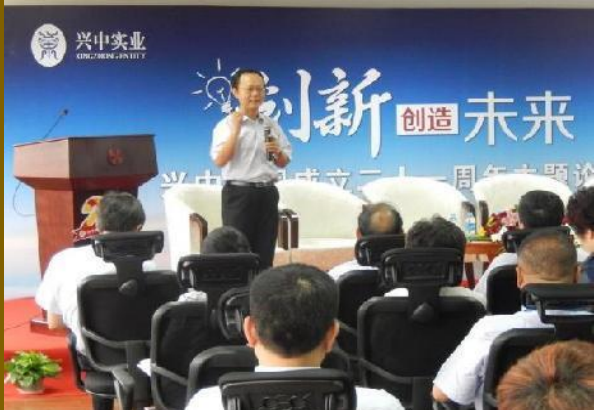
上海兴中实业 《领导者的创新思维》