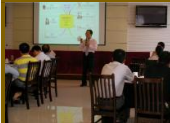
湖南省电力总公司·领导决策创新