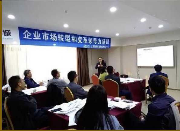
2019年西安公开课 《企业市场化转型和变革领导力》