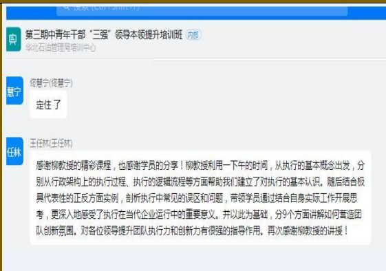
2021年9月23日华北油田线上直播课 《创造性执行》