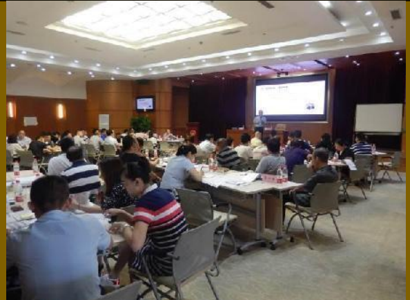
2019年重庆北域建设公司 《新国企市场化转型和管理创新》