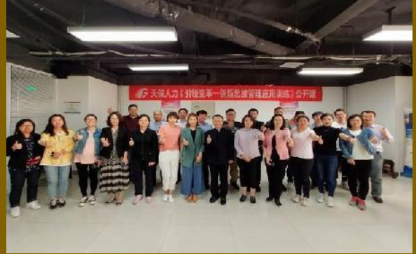
天津公开课 《引领变革：创新思维管理应用训练》