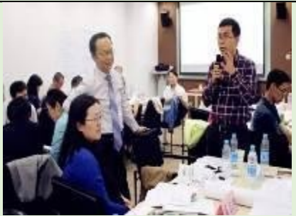
中关村领军企业公开课 《打造创新型领导力》