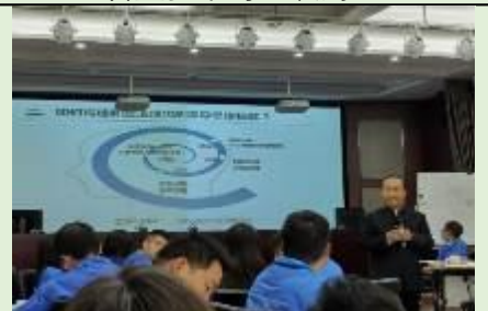
西安北方惠安化学工业公司 《系统管理思维与领导艺术》