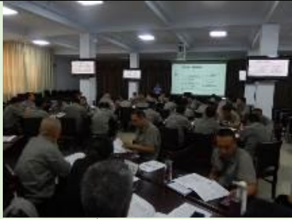
宣钢集团 3 场 《企业转型和管理变革》