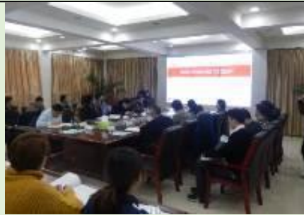
国网山西综合能源 《国企市场化转型和管理创新》