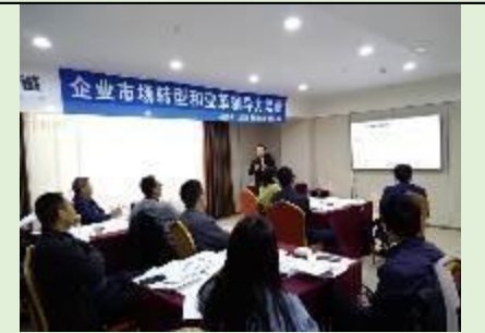
2019 年西安公开课 《企业市场化转型和变革领导力》