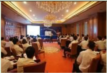
西安华陆集团·企业变革管理