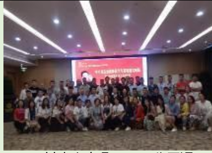
四川省会东县 2019 公开课 《中小微转型和盈利模式创新》