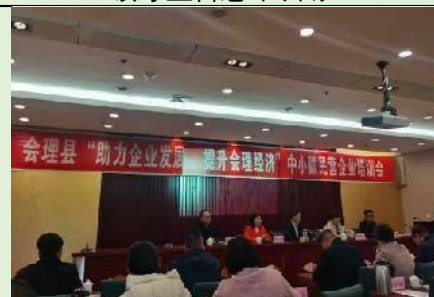
2020年四川凉山会理公开课 《中小微企业盈利模式创新》