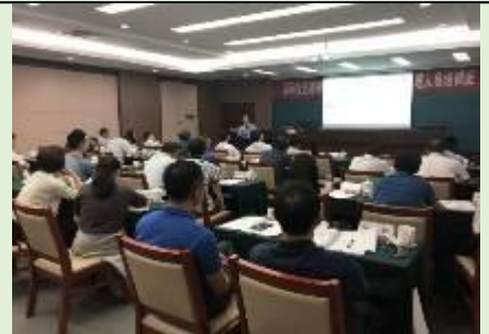
江苏省电力公司 《转型变革与组织沟通》