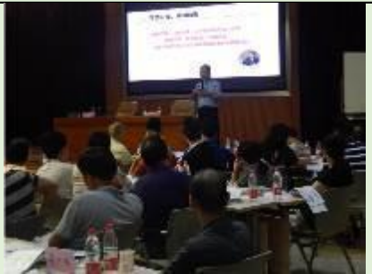
重庆北域建设有限公司 《新国企市场化转型和管理创新》