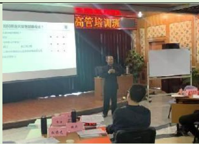
2020年北京排水集团 《国企市场化转型和管理创新》