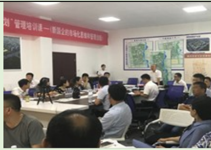
山东恒建集团 《新国企的市场化思维和管理创新》