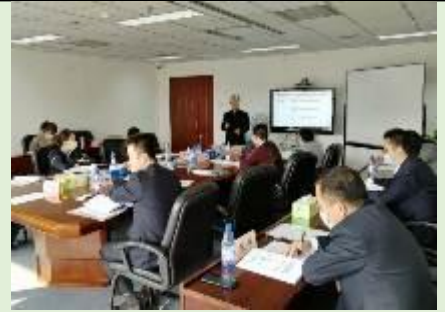
2020 国网新能源建设公司 《企业战略变革与落地推行》