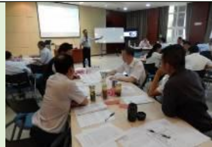
云南驰宏锌锗 领导整合思维训练