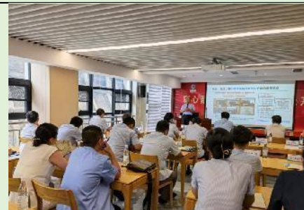
2022年6月29日青岛海润集团 《国企改革市场化思维和管理创新》