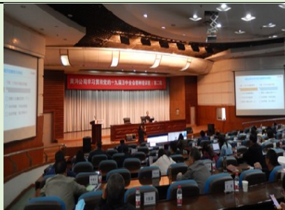
2021年5月国电投黄河公司 《国企改革三年行动聚焦与突破》