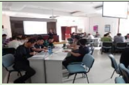
哈尔滨铁路局·企业变革管理