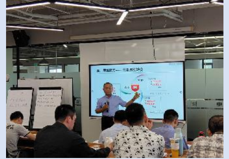
2021年9月北京国能中电公司 《系统思维与科学决策》