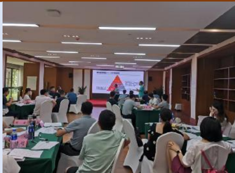
2022年7月中铁集团投资公司《领导 整合思维》