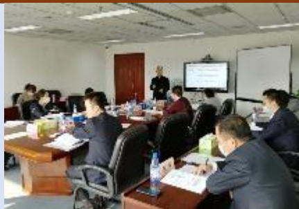
2020国网新能源建设总公司 《企业战略变革与落地推行》