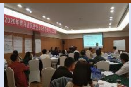
2020年青海省民营企业企业家公开课 《企业战略转型与盈利模式创新》