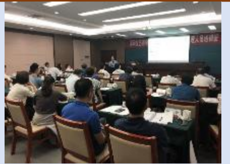
江苏省电力公司 《转型变革与组织沟通》