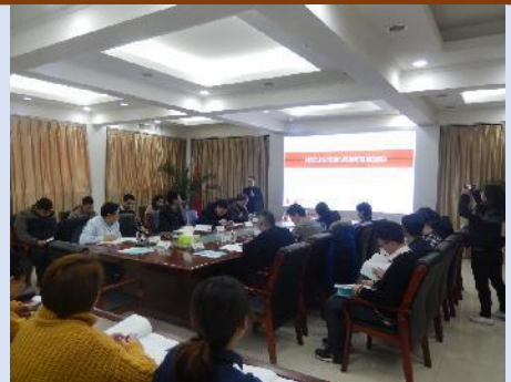
国网山西综合能源服务公司 《新国企的市场化思维和管理创新》