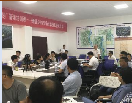
山东恒建集团 《新国企的市场化思维和管理创新》