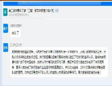
2021年9月23日华北油田线上直播课 《创造性执行》