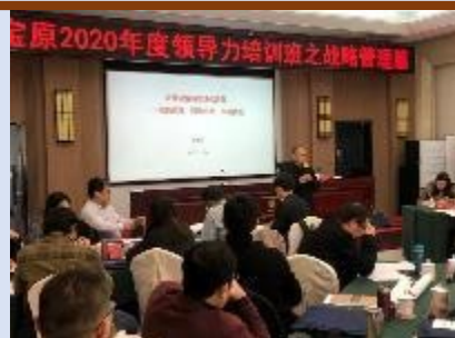
2020中国宝原集团 《市场化转型和市场化运营》