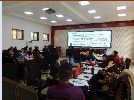
中国农业银行内蒙古分行 《新常态下的创新思维和管理创新》