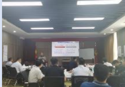
2021年6月国电投黄河集团第2场 《国企改革三年行动聚焦与突破》