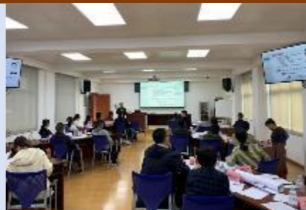
2020年广西天成投资 《现代企业的创新战略与创新管理》