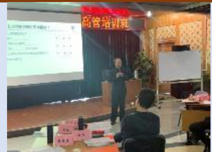
2020年北京排水集团高层 《国企市场化转型和管理创新》