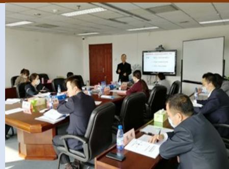
2020年国网新能源建设公司 《企业战略变革与落地推行》