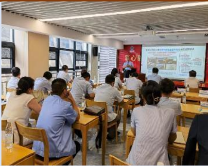
2022年6月青岛海润集团《国企改革 市场化思维和管理创新》