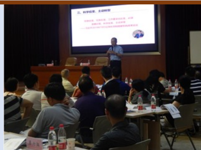
重庆北域建设有限公司 《新国企市场化转型和管理创新》