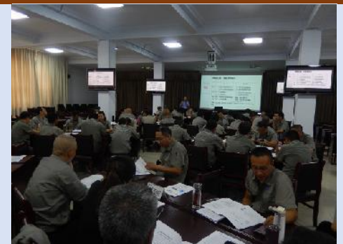
宣钢集团连续3期《企业转型和管理变革》 《市场化思维和管理创新》