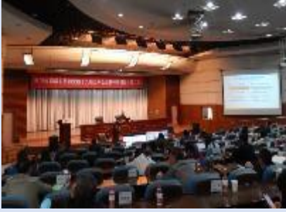
2021年5月国电投黄河集团 《国企改革三年行动聚焦与突破》