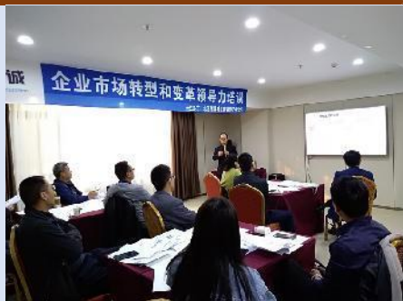
2019年西安公开课 《企业市场化转型和变革领导力》