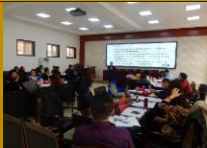
农行内蒙古分行·问题解决