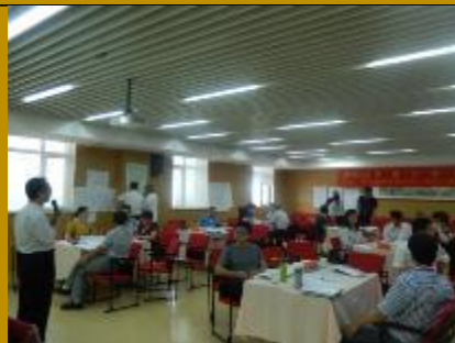
温州华仪公司·问题分析解决