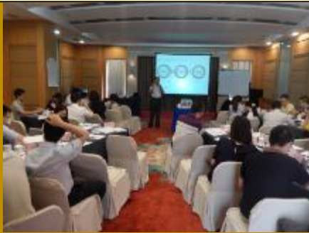
中信银行总行·解决问题 2场

华润雪花啤酒公司（5场次共10天）、中信银行总行（2场）、重庆北碚区供电局（3场）、亚宝药业（问题分析与解决行动学习工作坊2期4天）、通辽热电厂（问题分析与解决行动学习工作坊2天）、中国太平财险河北分公司（问题分析与解决行动学习工作坊2天）、中国银行郑州新区支行、中国农业银行天津红桥支行、中国农行天津宁河支行、温州华仪集团、上海浩登材料科技公司、河南省电力总公司、江苏盐城东方集团、中国银行山东德州分行、内蒙古霍煤鸿骏铝电有限责任公司（问题分析与解决行动学习工作坊2天）、国家电网山西综合能源服务公司、威海市清华大学总裁班公开课、河南省供电总公司等。