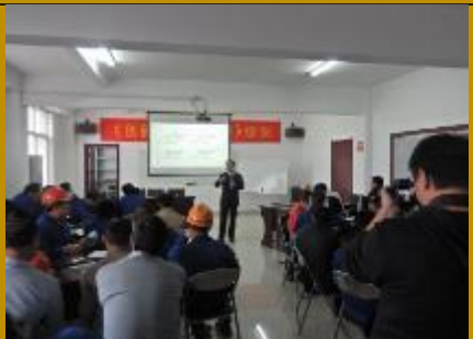
上海浩登材料公司·创造性解决问题