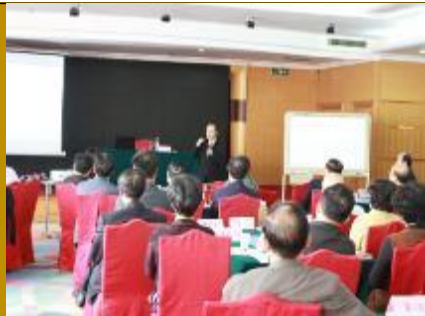
威海市党政机关公开课·问题解决