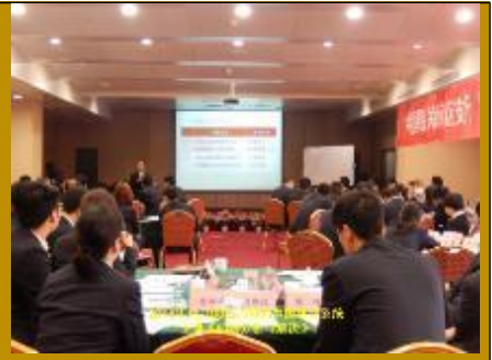
中国银行郑州分行·解决问题