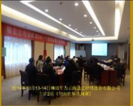
云南驰宏锌锗·创造性解决问题 2014年10月13-14日柳瑞军为云南驰宏锌锗股份有限公司 主讲2场《创造性工作和解决问题》