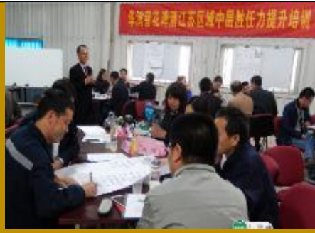
华润雪花啤酒·系统解决问题 5场