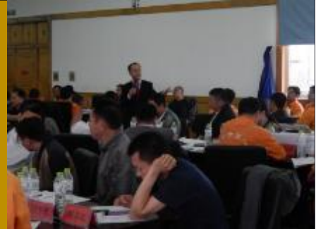
山东东明石化集团·问题分析