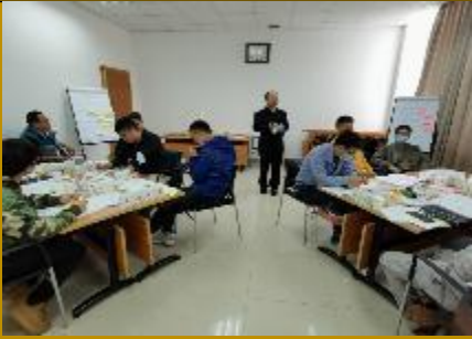
2020年广东核电集团 《六顶思考帽与创造性解决问题》