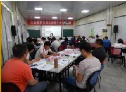
亚宝药业·解决问题工作坊 2 场