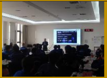
2019 沧州中铁集团第 2 场 《创新思维与问题决策》