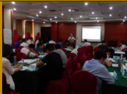
农行天津宁河支行·问题解决