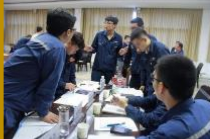
通辽热电厂·解决问题工作坊