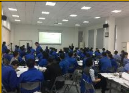
湖北黄石东贝集团·领导决策