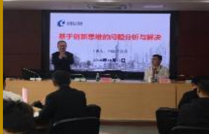
盐城东方集团·创造性解决问题