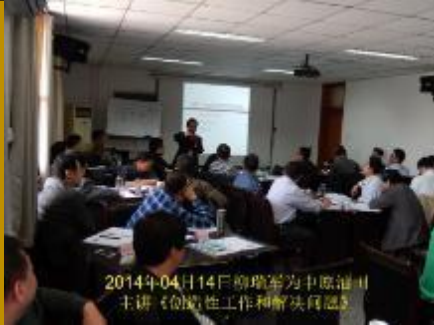
中原油田·创造性解决问题 2014年04月14日柳瑞军为中原油田 主讲《创造性工作和解决问题》