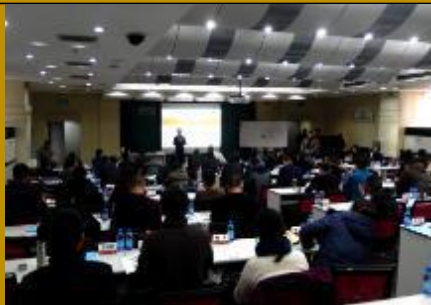
河南省供电总公司·问题解决