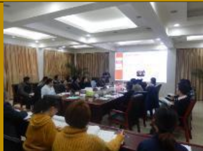
国家电网山西能源公司