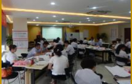
太平财险河北公司·解决问题工作坊