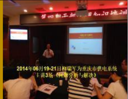
重庆北碚区供电公司·问题解决 3场 2014年06月19-21日柳瑞军为重庆市供电系统 主讲3场《问题分析与解决》