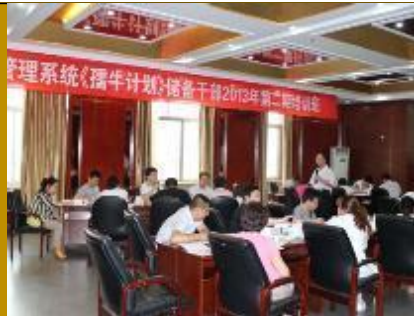
蒙牛乳业·创造性解决问题 2 场