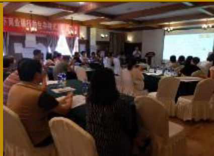
农行天津红桥支行·问题解决