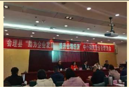
2020年四川凉山会理公开课 《中小微企业盈利模式创新》