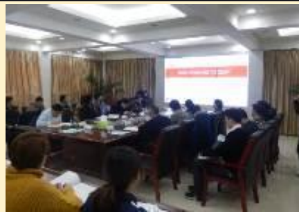
国网山西综合能源 《国企市场化转型和管理创新》