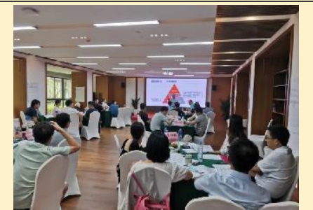
2022年8月中国中铁投资公司 《领导者整合思维训练》