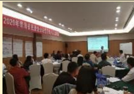
2020 年青海省企业家公开课 《企业战略转型与盈利模式创新》