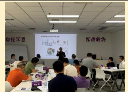
2021年10月中海油深圳 《水平思考与六项思考帽》