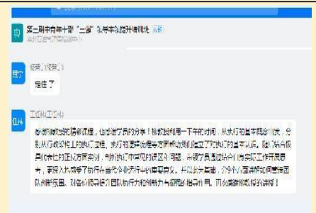
2021年9月23日华北油田线上直播课 《创造性执行》