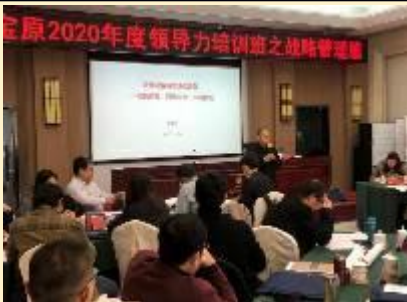
2020 年中国宝原集团 《市场化转型和市场化运营》