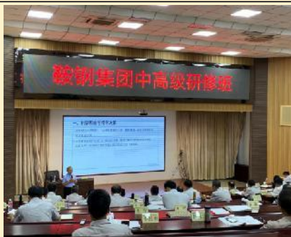
2021年9月鞍钢集团 《创新思维与领导决策》