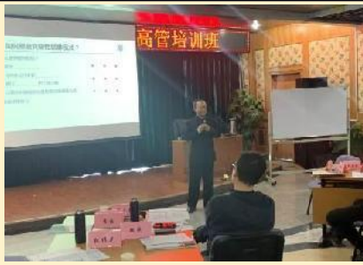
2020年北京排水集团 《国企市场化转型和管理创新》