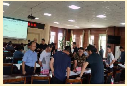
2021年7月国能集团铁路装备公司 《创新思维与工作创新》