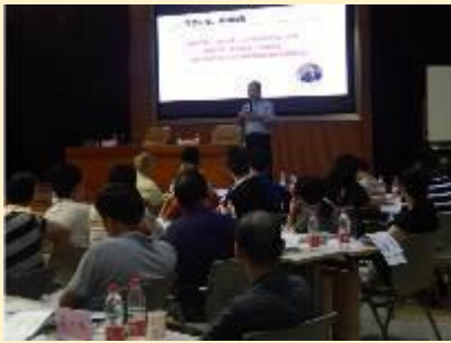
重庆北域建设有限公司 《国企市场化转型和管理创新》