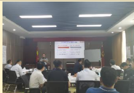
2021年6月国电投黄河公司 《国企改革三年行动聚焦与突破》