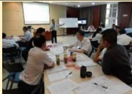
云南驰宏锌锗 领导整合思维训练