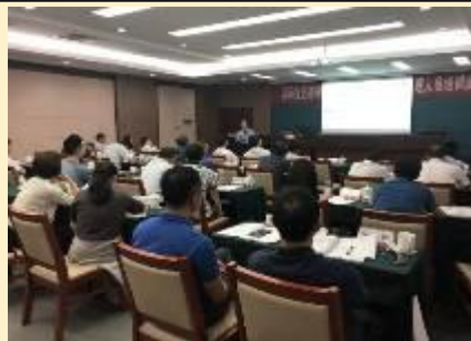
江苏省电力公司 《转型变革与组织沟通》