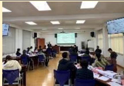
2020年广西天成投资 《现代企业创新战略与创新管理》