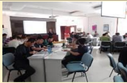
哈尔滨铁路局·企业变革管理