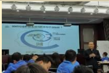
西安北方惠安化学工业公司 《系统管理思维与领导艺术》