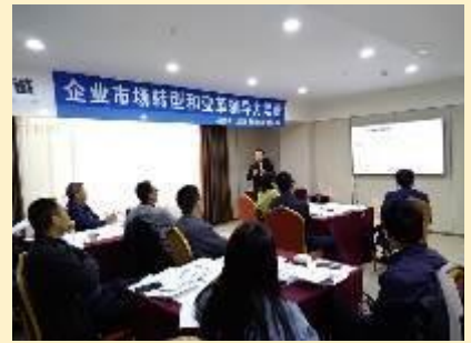
2019 年西安公开课 《企业市场化转型和变革领导力》