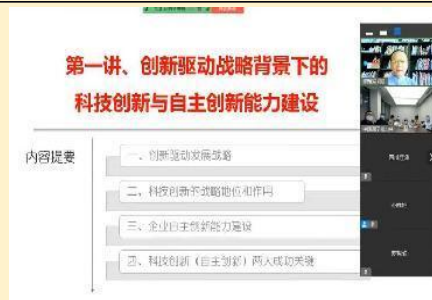
2022年9月中国原子能线上直播课 《创新思维与科技创新能力提升》。