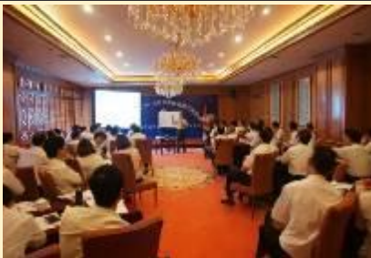
西安华陆集团·企业变革管理