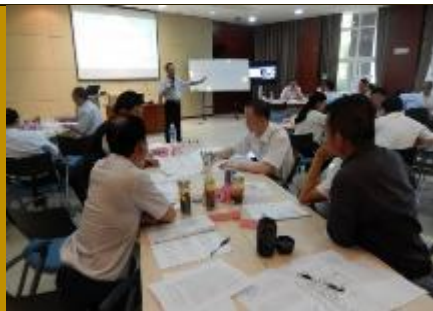
云南驰宏锌锗 《领导的整合思维》