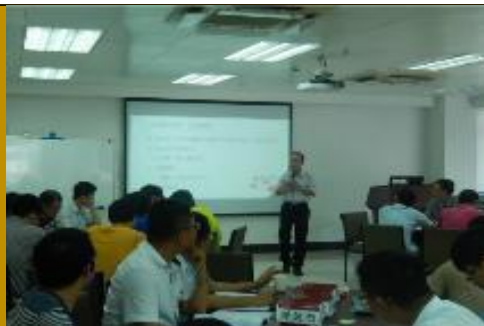
广东某电力公司 《整合思维训练》2场