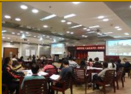
上海盈高科技公司 系统思考应用训练