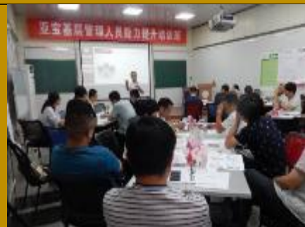
亚宝药业 《问题分析与解决工作坊》2场