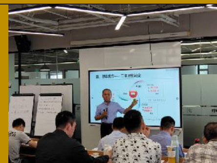
2021年9月北京国能中电公司 《系统思维与科学决策》