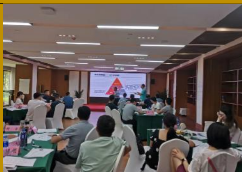
2022年8月中铁集团铁投公司 《领导整合思维训练》