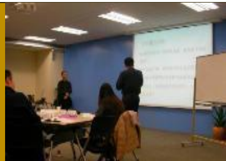
华泰保险总公司 《系统管理创新》