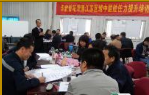
华润雪花啤酒公司 《系统思维与解决问题》5场