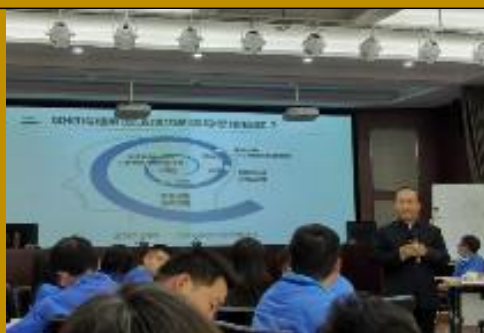
2020 西安北方惠安化学工业公司 《系统管理思维与领导艺术》