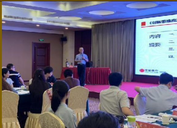
中信银行济南分行 《创新思维管理应用训练》