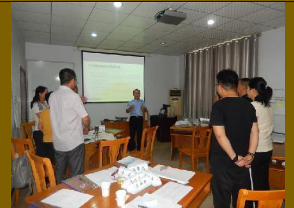
衡水市供电公司 《创新思维管理应用训练》