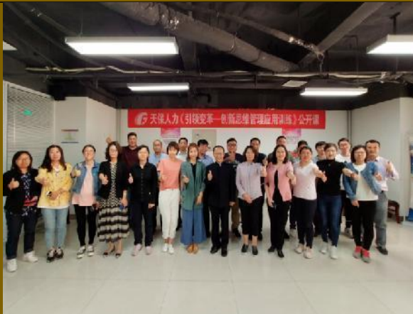
天津公开课《引领变革：创新思维管理应用训练》