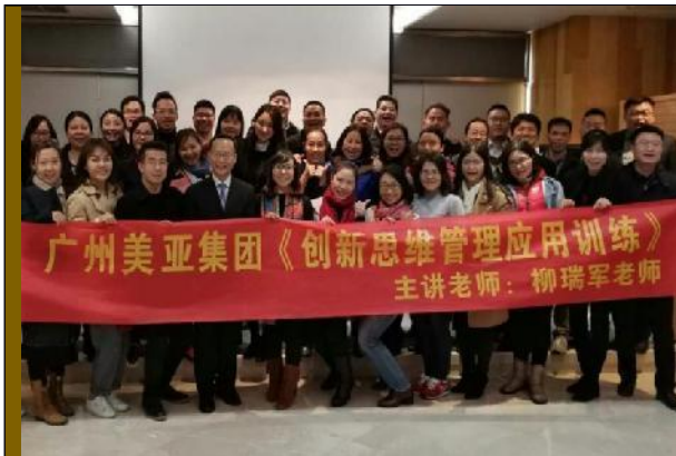
广州美亚集团《创新思维管理应用训练》