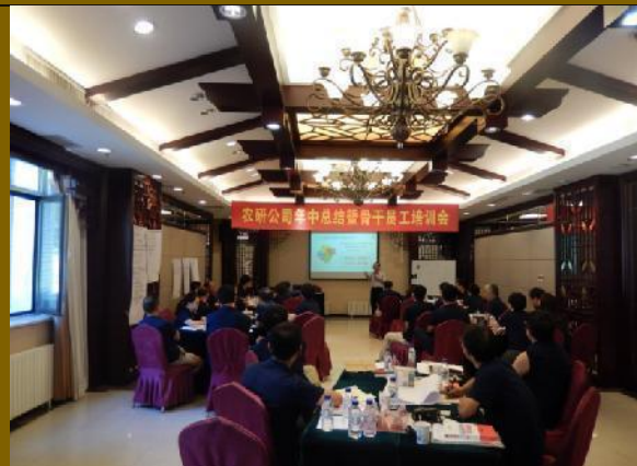
沈阳农研公司全体研发人员 《创新思维研发管理应用训练》