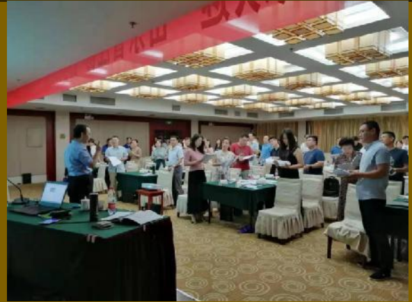
山东注册会计师协会主办公开课 《创新思维管理应用训练》