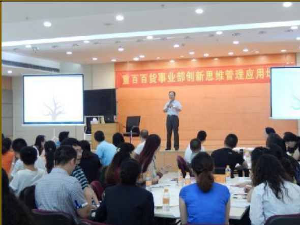
重庆百货公司《创新思维管理应用训练》