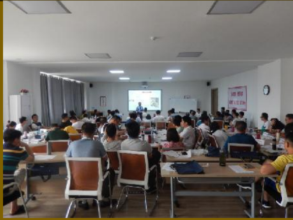
中国铝业《创新思维管理应用训练》