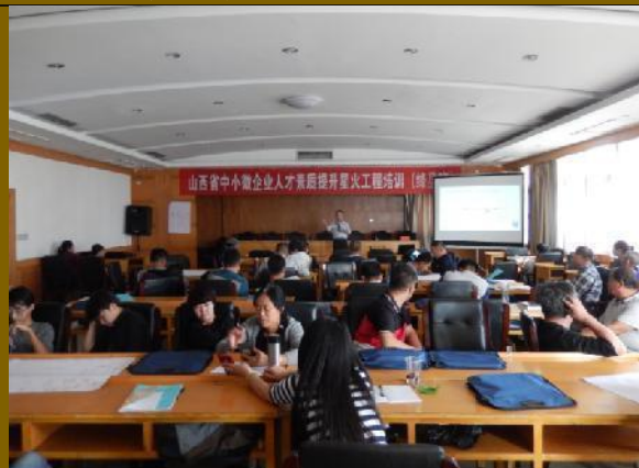
山西省公开课《创新思维管理应用训练》