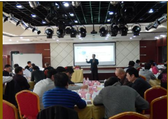
北京平谷供电公司《创新思维管理应用训练》