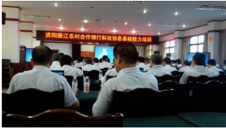
资阳农村合作银行 课程