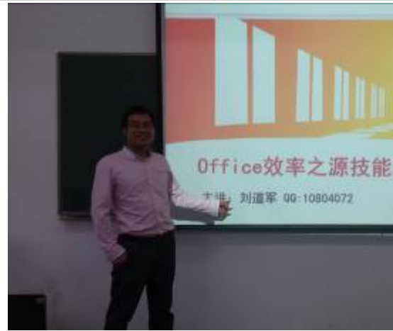
武汉光谷联合集团