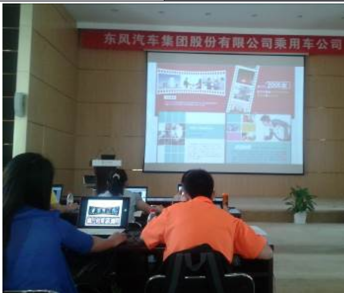
东风汽车集团完美 PPT 设计 课程