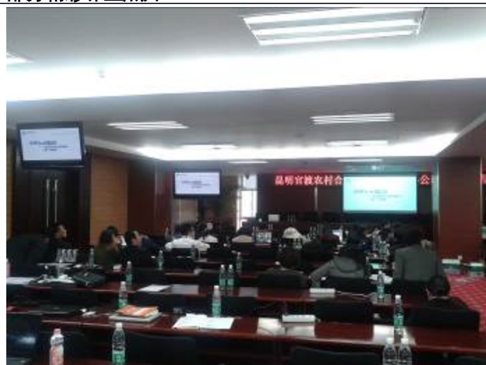
昆明官渡农村合作银行 Office 系列课程