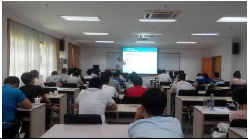
国网公司福建分公司