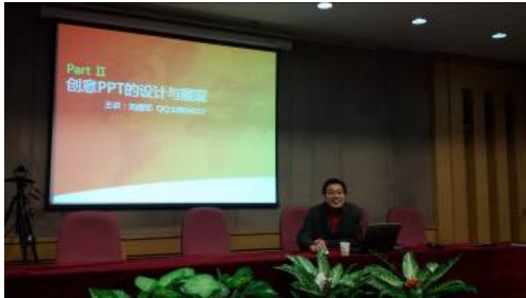
内蒙邮政 储蓄银行