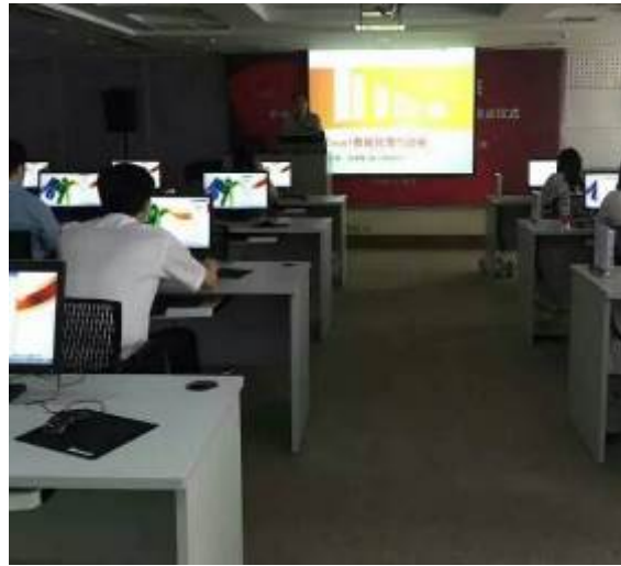
民生银行（武汉）分行