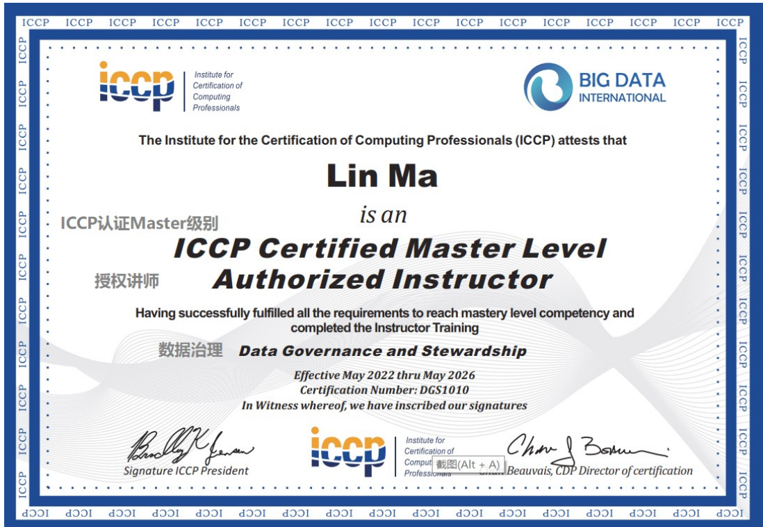
ICCP认证Master级别授权讲师 《数据治理》证书