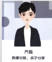
齐盛 热爱交际，乐于分享