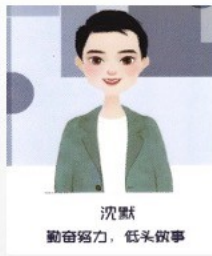
沈默 勤奋努力，低头做事