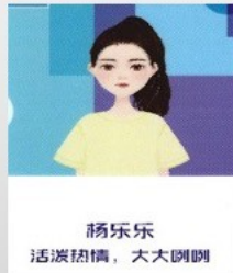
杨乐乐 活泼热情，大大咧咧