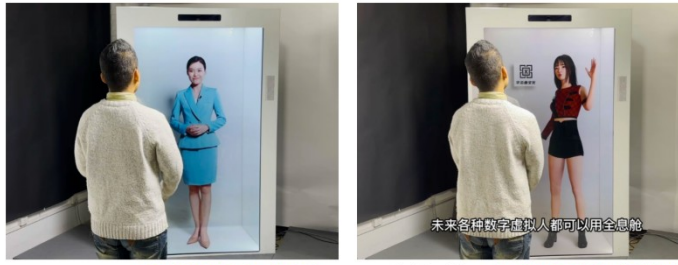
真人实拍互动版— 真人实拍AIGC数字人（低成本）

基于ChatGPT + AIGC 技术的全息数字人 通过全息舱呈现裸眼3D真人视觉体验