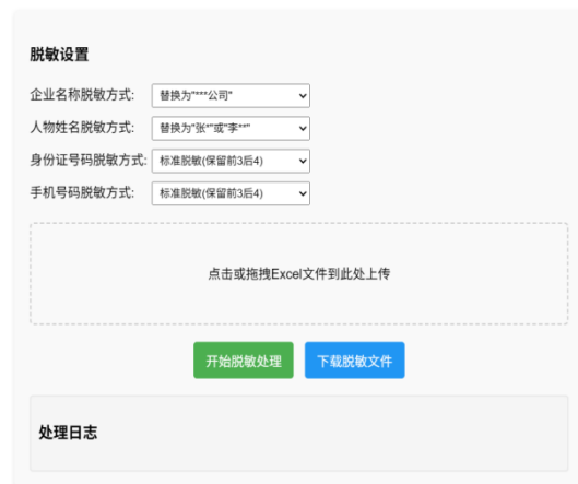
文档资料自动化脱敏工具