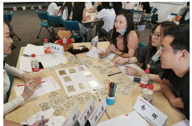
平安银行深圳分行新员工欧卡沙龙