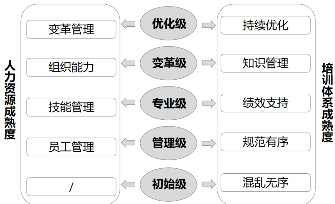
★ 课程内容展示 1：培训体系成熟度模型