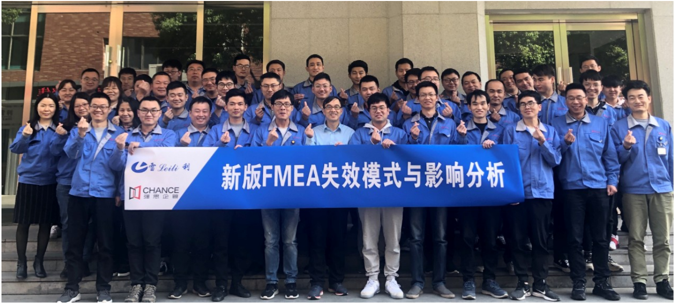
雷利集团新版 D/PFMEA 培训