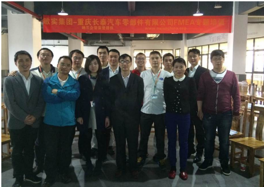
敏实集团新版 D/PFMEA 培训